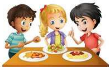
Рисунок 2. Два правила, как вести застольную беседу